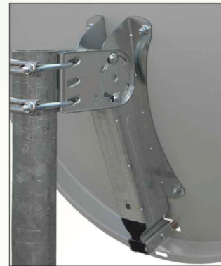
AZ-EL e supporto in lamiera zincata e rinforzata con doppia staffa di fissaggio al palo